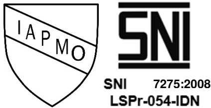
Gambar 1. Tanda sertifikasi dan SPPT SNI